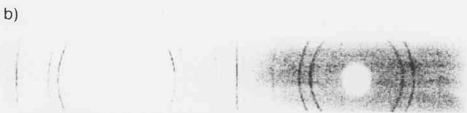
Abb. 11.29a,b. Debye-Scherrer-Verfahren: (a) Experimentelle Anordnung; (b) Aufnahme der ringförmigen Interferenzmaxima von Kupferpulver. Aus H. Raether: Elektroneninterferenzen, in: Handbuch der Physik , Bd. 32 (1957)